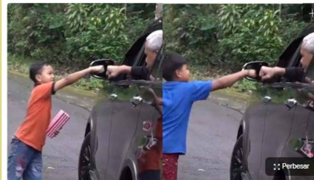
Gubernur Jawa Tengah Ganjar Pranowo mengaku bernama Tugiman kepada dua anak-anak yang tengah bermain di jalan

Liputan6.com, Semarang - Gubernur Jawa Tengah Ganjar Pranowo mengaku bernama Tugiman kepada dua anak-anak yang tengah bermain di jalan. Momen itu bagikan Ganjar Pranowo melalui potongan video yang diunggah pada laman akun Twitter pribadinya @ganjarpranowo.