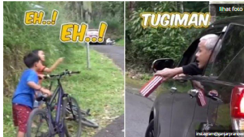
Potongan video dua bocah dipanggil Ganjar Pranowo yang mengaku Tugiman