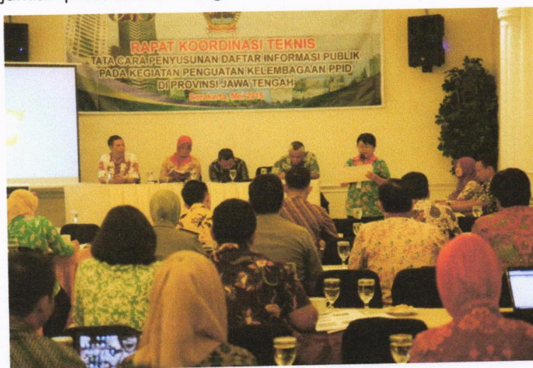
Gambar 3. Rapat Koordinasi Teknis

Penilaian Pemingkatan badan publik yang dilaksanakan oleh Komisi Informasi Provinsi Jawa Tengah lingkup Provinsi Jawa Tengah dilakukan pada bulan Oktober hingga November 2015 yang terdiri dari penilaian kuesioner penilaian mandiri, penilaian situs web dan visitasi/kunjungan lapangan.