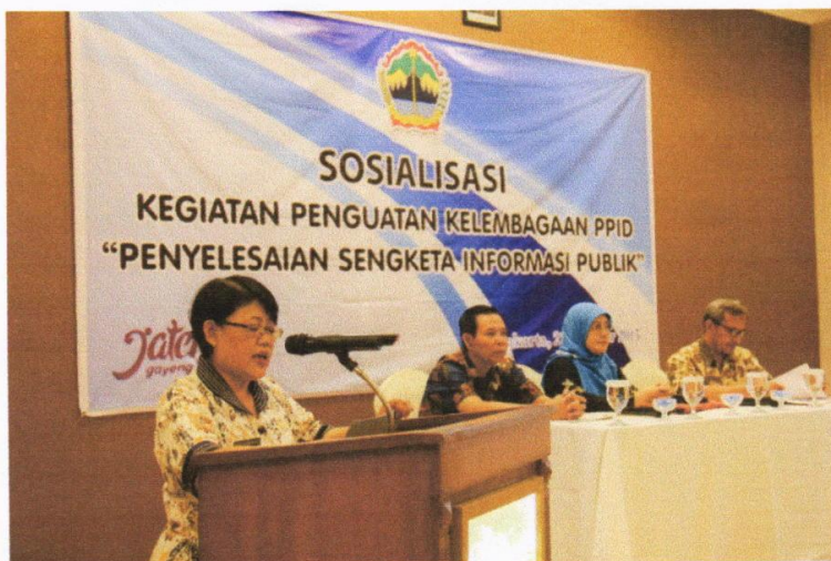
Gambar 2. Sosialisasi Penyelesaian Sengketa Informasi