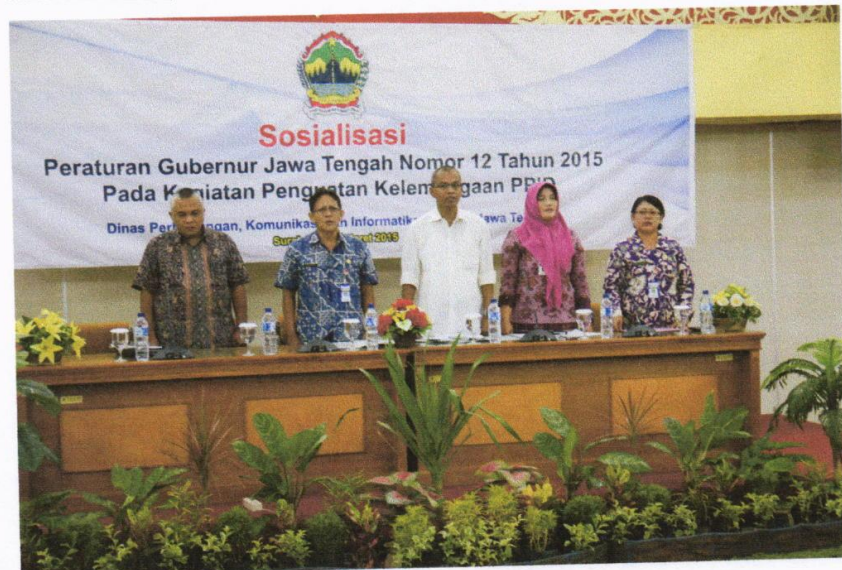
Gambar 1. Sosialisasi Peraturan Gubernur No 12 Tahun 2015